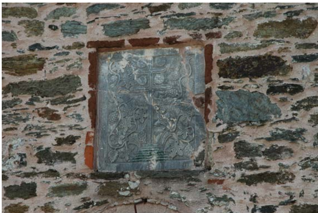
Βυζαντινό θωράκιο του 12 ου αι., εντοιχισμένο στη μονή Θεολόγου στη Βελίκα, στο οποίο εικονίζεται σταυρός περιβαλλόμενος από βλαστούς αμπέλων. Το θέμα της αμπέλου είναι πολύ συχνό στη μεσοβυζαντινή γλυπτική του Όρους των Κελλίων.

Η πλούσια παραγωγή κρασιού της Μελιβοίας συνεχίστηκε και στη νεότερη περίοδο, από την οποία υπάρχουν και οι περισσότερες γραπτές